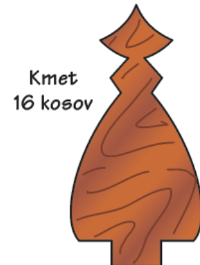
Kmet 16 kosov