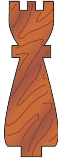
Trdnjava 4 kosi