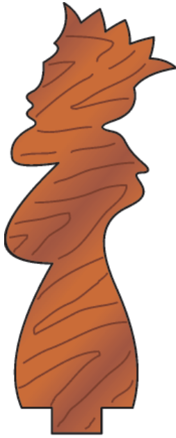
Kralj 2 kosa