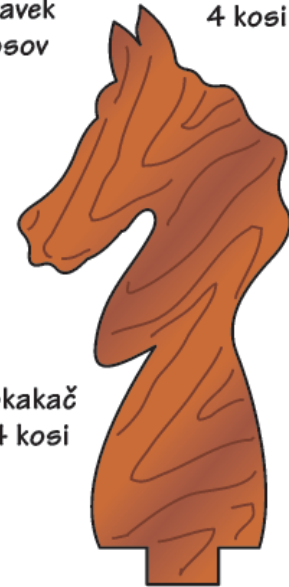
Skakač 4 kosi