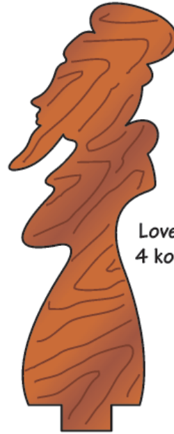
Lovec 4 kosi