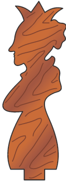
Dama 2 kosa